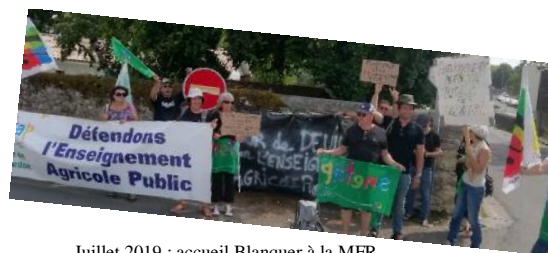
Juillet 2019 : accueil Blanquer à la MFR

Depuis près de 20 ans les inégalités scolaires et le poids des déterminismes sociaux dans la réussite scolaire ont augmenté. C'est la conséquence des politiques éducatives libérales successives. Les questions d'éducation seront abordées à la lueur des réformes Blanquer. Quels mandats offensifs en écho aux mobilisations ? Quels contenus et pratiques pour une culture commune ? Quelle organisation du service public d'éducation pour combattre les inégalités ? Comment retrouver notre sens du métier et le pouvoir d'agir enseignant ?