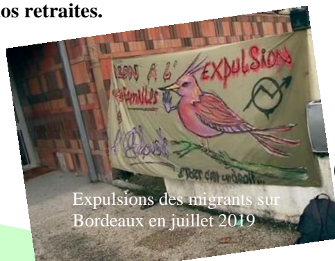
Expulsions des migrants sur Bordeaux en juillet 2019