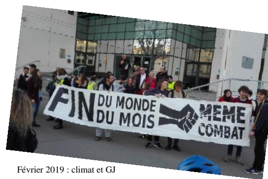
Février 2019 : climat et GJ

Les politiques néolibérales menées sont mortifères : non seulement elles ne cessent de renforcer les inégalités entre riches et pauvres mais mettent en danger nos écosystèmes en dérégulant le climat et la nature. Ces politiques liées à la mondialisation libérale et à l'austérité généralisée font l'objet d'un rejet de plus en plus net de la population. Face à cette contestation ce sont l'autoritarisme, la répression et la dépossession démocratique qui sont mobilisés. Comment imposer des politiques publiques alternatives au libéralisme ? Comment combattre ce pouvoir de plus en plus autoritaire, notamment sur tous les reculs des droits et libertés ?